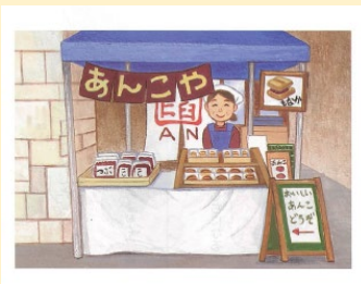
【道徳・教出・2年】より