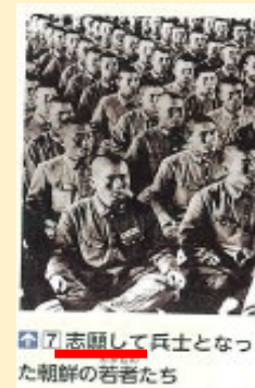
【社会・東書・6年】より

いまの教科書に「多くの朝鮮人と中国人が強制的に連れてこられた」と書いてあった部分が、「動員された」に変更され、「兵士になった朝鮮の若者たち」の写真(⇒)のキャプションに、「志願して」という言葉が加わっています。