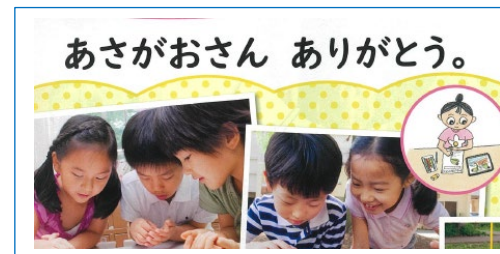
【生活・学図・2年】より

生活科で花や野菜を育てたり、動物を観察したりする時に、花や野菜に名前をつけたり、「〇〇さん、ありがとう」、「びっしりと根をはっていたん