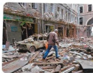
⑥ロシア軍の攻撃でこわれた建物の中を歩く人(2022年、ウクライナ)