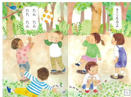
【国語・東書・1年】より

1年生の国語の最初のページから文字が出てきたり、初めて教科書を使う5年生の英語の目次にいきなり英文が並んでいたり。5～6年で扱う英語の単語数は600～700語とされていますが、ほとんどの教科書が今より増え、800語を超える教科書もあります。