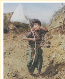
【社会・教出・6年】より

沖縄戦で、住民が「戦争に総動員され、戦闘に巻き込まれ」た結果、「追いつめられて、集団自決した人も多数いました」と書かれていた教科書(日文・6年)から、「戦争に総動員され」が削られ、「アメリカ軍の激しい攻撃に追いつめられた」ことで「集団自決」にいたったかのように変更されました。これによって3社すべてが、この観点での記述となってしまいました。