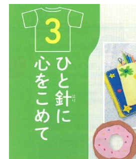
【家庭・東書・5・6年】より

英語の教科書(教出・5年)に「はしのうえのおおかみ」という「道徳」の題材を英訳した漫画を載せ、おおかみの気持ちの変化を考えるページがありました。家庭科で針と糸を使って縫物をする単元名が「ひと針に心をこめて」。「道徳」的な要素の強まりが気になりました。