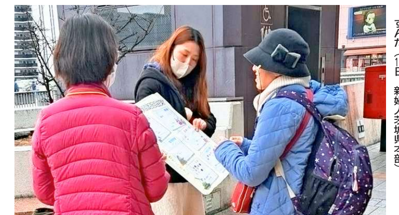
「物価高で、買い物に困る」ジェンダー政策が進ず、将来が不安」など対話がはじまった(19日、新婦人茨城県本部)

高市首相が衆議院を解散するのは、なぜなのか。それははっきりしている。政権がもたないからです。強いイメージを先行させて支持率を高めようとしても、衆議院でかろうじて過半数、しかもスキャンダルだらけの維新の閣外協力。参議院でも過半数はない。実際には統一協会、裏金問題が再燃する。経済、財政がボロボロ。田安とするのか。こんな時に中国を過度に